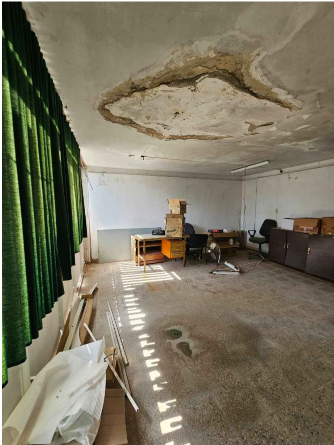
Local 1 - cielorraso adherido a losa