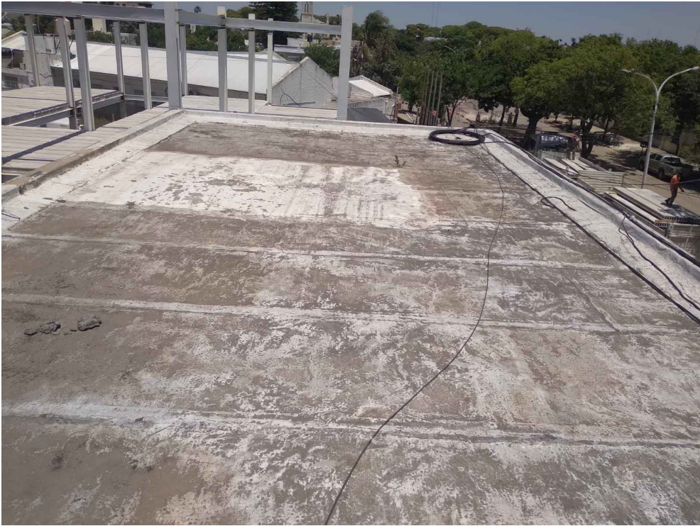
Losa a impermeabilizar